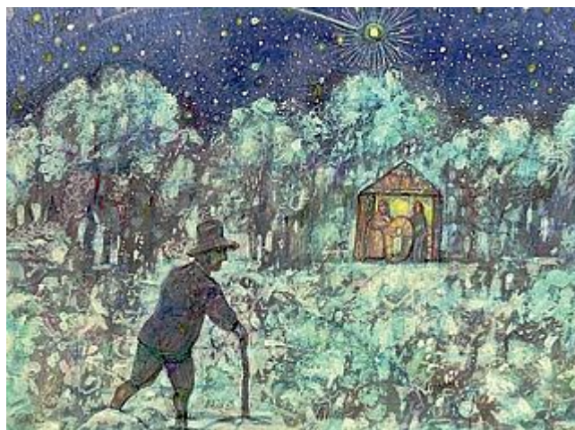
La bellissima stampa di Possenti dedicata alla Natività

Attraverso un regalo unico che il quotidiano ha voluto fortemente realizzare come omaggio agli stessi lettori in ogni area di diffusione dalla Toscana all'Umbria, fino a La Spezia. Oggi infatti - in abbinamento gratuito con il nostro giornale - tutti ma proprio tutti potranno trovare una stampa dedicata alla Natività realizzata in via del tutto esclusiva dal Maestro Antonio Possenti. Un'iniziativa che fa seguito al progetto 'Presepjamoci' lanciato da La Nazione, cui hanno partecipato centinaia di scuole e che